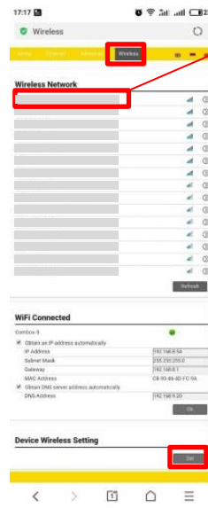
Figur 3 Opret forbindelse til webserveren på 160.190.0.1