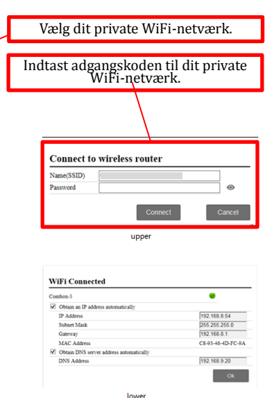
Figur 4 Opret forbindelse til dit private WiFi-netværk

Trin 2 Indtast zeversolar som adgangskode, og klik på "Connect" (se figur 2).