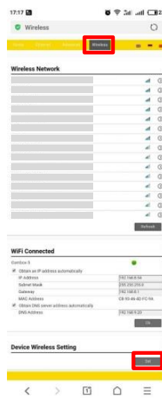
Rys. 3 Uzyskać dostęp do serwera sieciowego 160.190.0.1