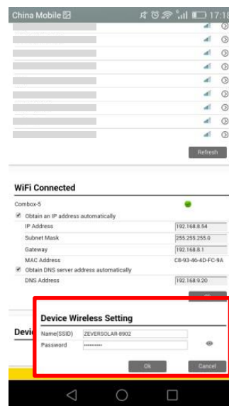
Rys. 4 Zmienić hasło na bezpieczne

Krok 2 Wprowadzić hasło zeversolar i kliknąć Connect (Połącz) (patrz rys. 2).